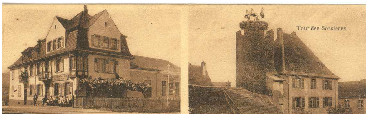
HERRLISHEIM près Colmar (Haut-Rhin). — Restaurant de la Gare - Prop. Paul Ulmer