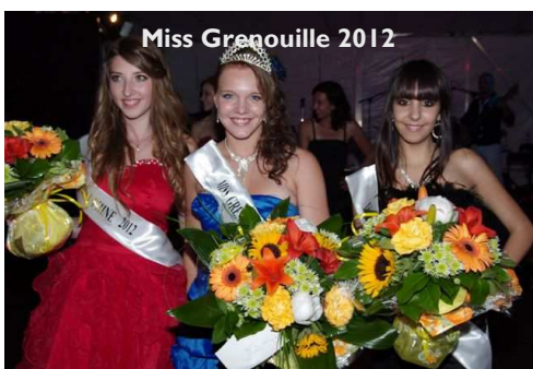
Miss Grenouille 2012