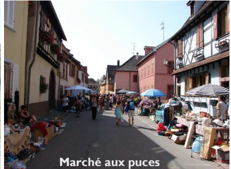
Marché aux puces