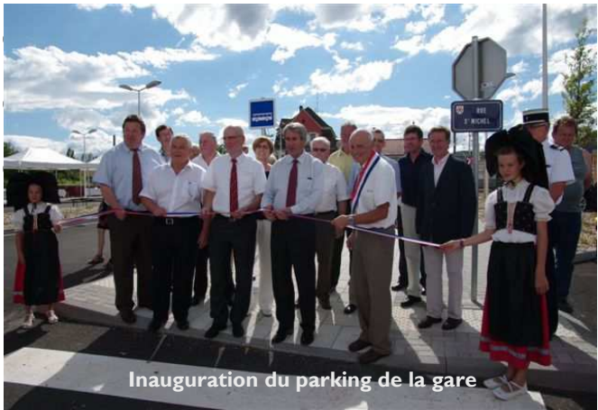
Inauguration du parking de la gare

Sans oublier le feu d'artifice du 14 juillet et toutes les autres manifestations estivales de notre beau village fleuri.