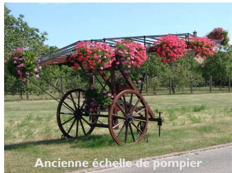
Ancienne échelle de pompier