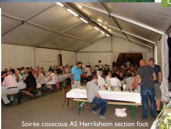
Soirée couscous AS Herrlisheim section foot