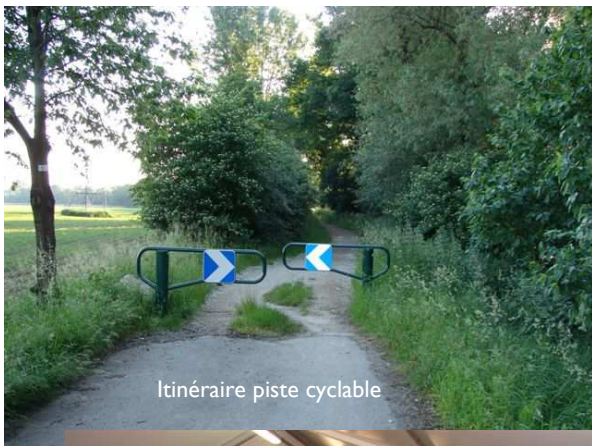
Itinéraire piste cyclable