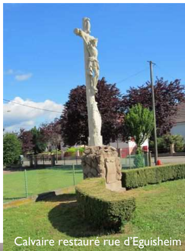
Calvaire restauré rue d'Eguisheim