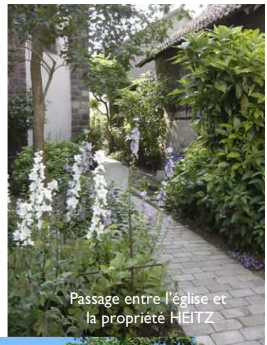
Passage entre l'église et la propriété HEITZ