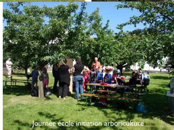
Journée école initiation arboriculture