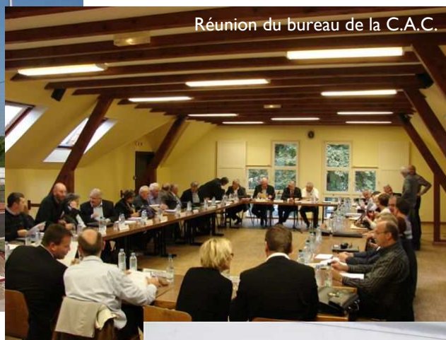
Réunion du bureau de la C.A.C.