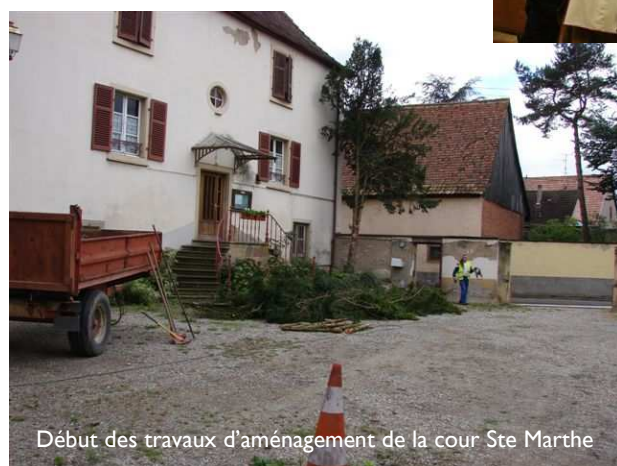
Début des travaux d'aménagement de la cour Ste Marthe