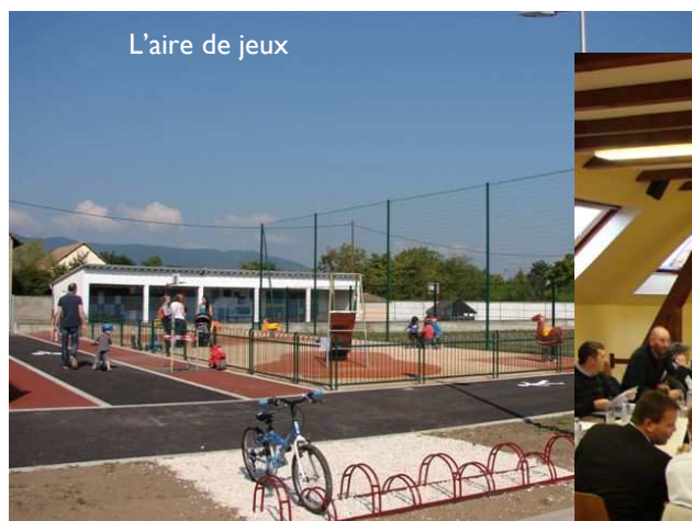
L'aire de jeux