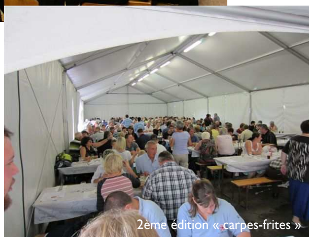
2ème édition « carpes-frites »