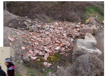
Dépôt sauvage de tuiles sur l'ancienne RN 83 dans le vignoble