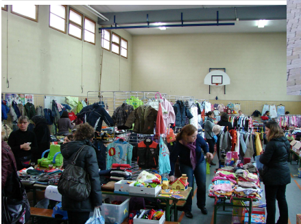
Bourse aux vêtements et aux jouets