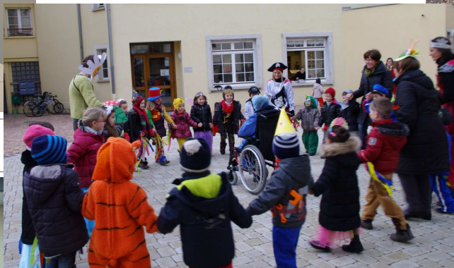
Carnaval des enfants de la maternelle