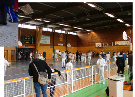
Tournoi de sabre au Cosc de Wintzenheim