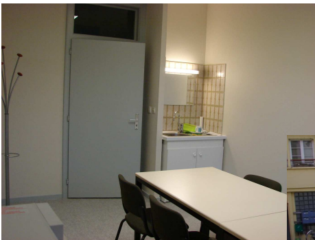
Nouveau réfectoire pour le personnel de la mairie