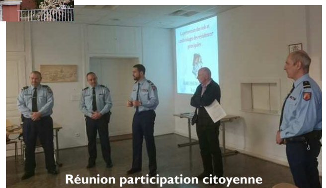
Réunion participation citoyenne