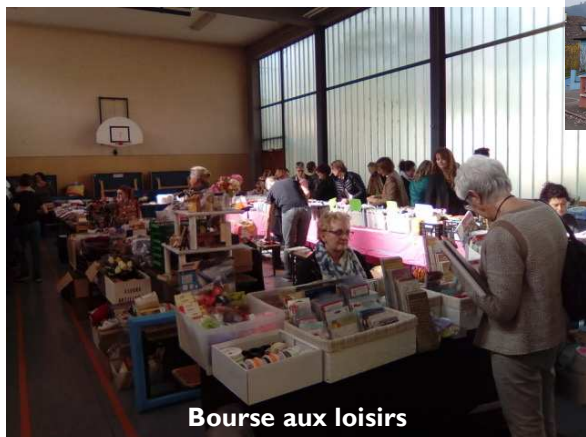
Bourse aux loisirs