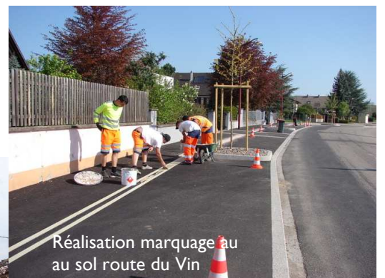
Réalisation marquage au sol route du Vin