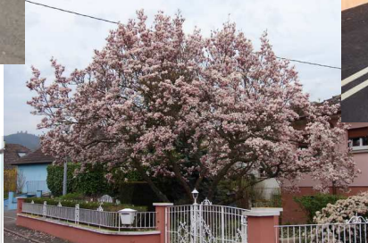
Magnolia rue des Alouettes