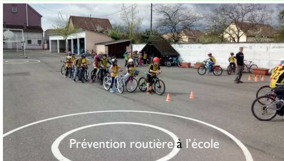
Prévention routière à l'école