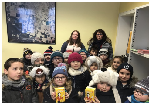
Les enfants de l'école sont venus déposer les tirelires de l'opération « pièces jaunes ».