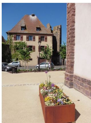
Parvis de l'église